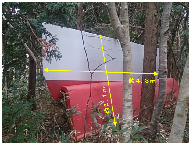
ナセルカバー落下状況