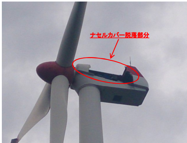
2号機ナセル拡大写真